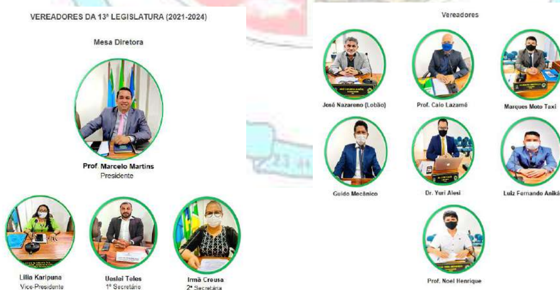
Quadro 01 – Organograma Funcional:

1.3. Apresentação do organograma funcional com descrição sucinta das competências e das atribuições das áreas, departamentos, seções, etc. que compõem os níveis estratégico e tático da estrutura organizacional da unidade, assim como a identificação dos principais processos pelos quais cada uma dessas subdivisões são responsáveis, os principais produtos deles decorrentes, indicando os nomes dos titulares de áreas estratégicas e os respectivos cargos que ocupam no período referido pelo relatório de gestão: